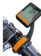
Ciclocomputer a partire da € 59,90